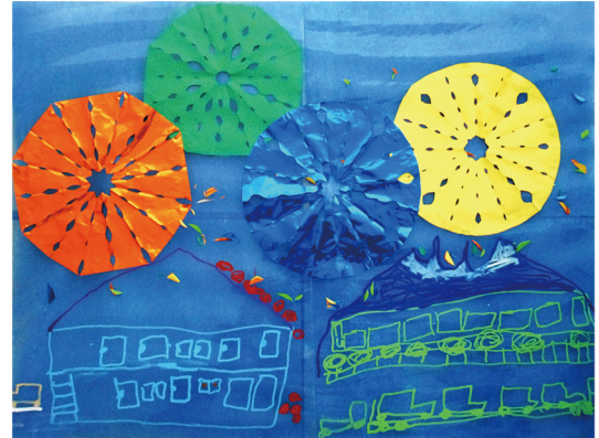
いとすぎ学級児童の作品「花火」

武蔵野赤十字病院にはご入院中の小・中学生のための院内学級（いとすぎ学級）があります。