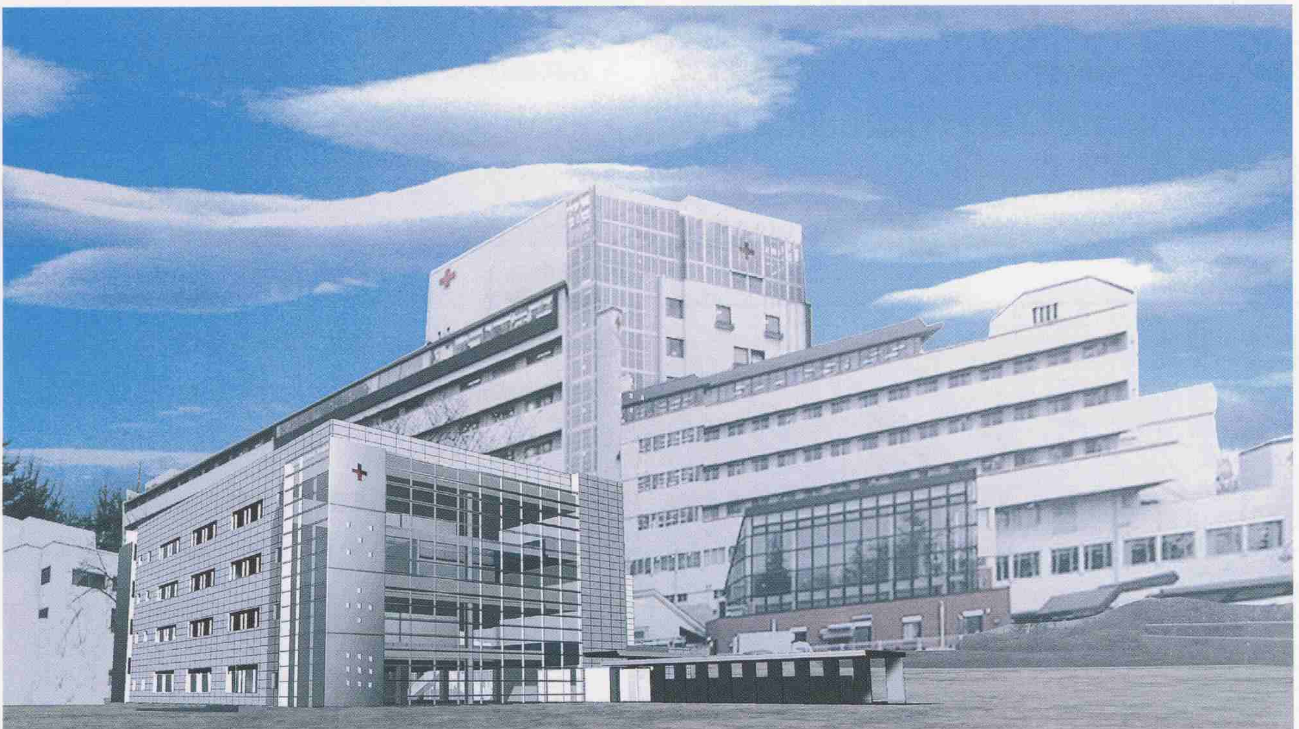
完成予想図で、実際の建物とは異なる可能性があります。

病院建物の北側で工事が始まります。これは、2006年3月完成予定の外来棟新築工事です。かねてから外来につきましては「診察室が狭い」「トイレが古い」「エスカレータがほしい」「待合室が狭い」など多くのご意見をいただいて参りました。しかし現在の1番館は1981年に完成してのものであり、完成後23年が経過した建物の部分的改修には限界が多く、ご要望に沿うには難しいものがありました。あわせて、救急センターが狭隘なため急患として受診される皆様にご迷惑をおかけしていることも本院の懸案